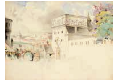
96. Aušros (Medininkų) vartai ir miesto siena Vilniuje / The Gates of Dawn (Medininkai Gate) and the city wall in Vilnius Popierius, akvarelė / Watercolour on paper, 52,8x71 LDM nuo 1980, T-7763