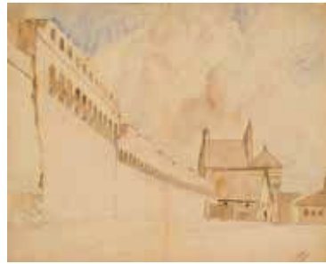
94. Subačiaus vartai ir miesto mūrai / Subačius Gate and the city wall. 1914 Popierius, akvarelė, pieštukas / Watercolour and pencil on paper, 36,6x45,6 LDM nuo 1980, B-689