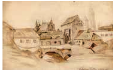
87. a) Vilniaus (Vilijos) vartai / Vilnius (Vilija) Gate Popierius, akvarelė / Watercolour on paper, 22,5x35,5 Ap. d. užr.: Vilniaus vartai 1800 m. LDM nuo 1980, T-7984/a