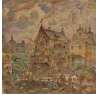
90. Totorių vartai / Tatar Gate. 1897 Popierius, akvarelė / Watercolour on paper, 70x71,2 Sign. ap. d.: Juozapas Komarowsky / Vilnius 1897 m. LDM nuo 1986, T-8278