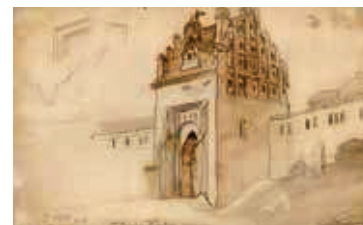
87. b) Totorių vartai / Tatar Gate. 1895 Popierius, akvarelė / Watercolour on paper, 22,5x35,5 Sign. ap. d.: J. Kamarauskas / 1895 m; ap. c. užr.: Totorių vartai 1800 m. LDM nuo 1980, T-7984/b