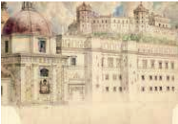
83. Žemutinės pilies rekonstrukcija / Reconstruction of the Lower Castle Popierius, akvarelė / Watercolour on paper, 70x101,3 LDM nuo 1980, T-10394