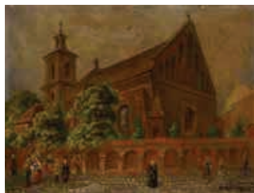
98. Šv. Mikalojaus bažnyčia / Church of St Nicholas. 1889 Kartonas, aliejus / Oil on cardboard, 38x50,5 Sign. ap. d.: Juozapas Komarovsky / Vilnius 1889 m. LDM nuo 1974, T-6474