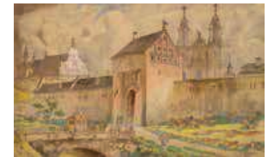
92. Vilnius (Vilijos) vartai / Vilnius (Vilija) Gate. 1898 Popierius, akvarelė / Watercolour on paper, 45,5x74 Sign. ap. d.: JUOZAPAS KAMARAUSKAS / Vilnius 1898 LDM nuo 1980, T-7767