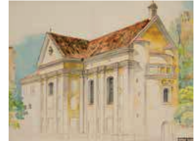
99. Šv. Stepono bažnyčia / Church of St Stephen. 1891 Popierius, akvarelė, pieštukas / Watercolour and pencil on paper, 45x58,2 Sign. ap. d.: JUOZAS KAMARAUSKAS / VILNIUS 1891-V-18 D LDM nuo 1980, T-7744