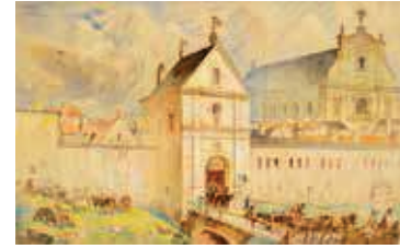
91. Vilnius. Trakų vartai / Vilnius. Trakai Gate. 1898 Popierius, akvarelė / Watercolour on paper, 45,5x74 Sign. ap. k.: Kamarauskas / 1898 LDM nuo 1980, T-8222