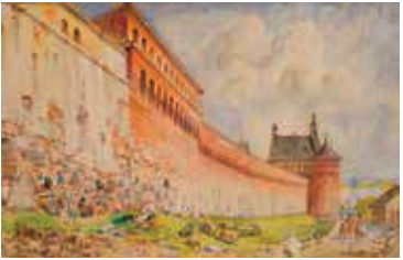
93. Subačiaus vartai ir miesto mūrai / Subačius Gate and the city wall. 1899 Popierius, akvarelė / Watercolour on paper, 41,5x66 Sign. ap. d.: Juozapas Kamarauskas / Vilnius. 1899 LDM nuo 1980, T-10395