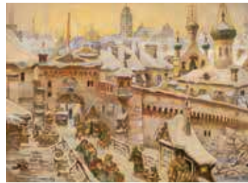
84. Vilniaus panorama su Spaso (Išganytojo) vartais / Panorama of Vilnius with the Spas (Saviour) Gate. 1892 Popierius, akvarelė / Watercolour on paper, 50,5x69,7 Sign. ap. k.: Juozapas Komarovsky; ap. d.: Vilnius 1892 m. LDM nuo 1980, T-7756