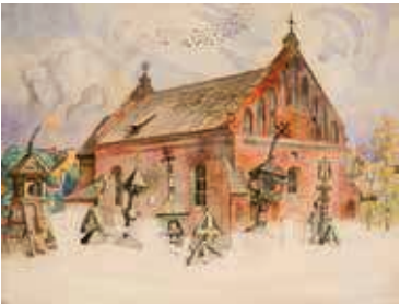
97. Šv. Mikalojaus bažnyčia / Church of St Nicholas. 1889 Popierius, akvarelė / Watercolour on paper, 44,7x58,3 LDM nuo 1994, T-10597