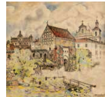
85. Totorių vartai Vilniuje / Tatar Gate in Vilnius. 1894 Popierius, akvarelė / Watercolour on paper, 70,2x73,7 Sign. ap. d.: JUOZAS KAMARAUSKAS / VILNIUS 1894 M LDM nuo 1980, T-8248