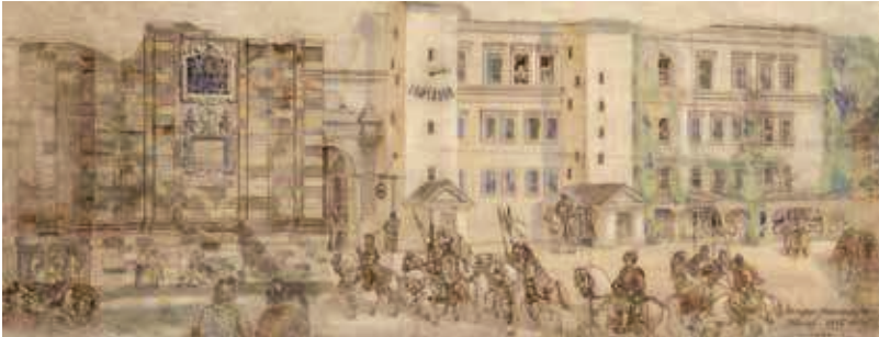
80. Žemutinė pilis ir Katedros Šv. Kazimiero koplyčia / Lower Castle and Chapel of St Casimir in the Cathedral. 1895 Popierius, akvarelė / Watercolour on paper, 38,9x99,6 Sign. ap. d.: Juozapas Kamarauskas / Vilnius. 1895 LDM nuo 1980, T-11828