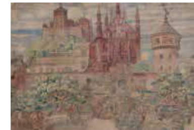
82. Vilniaus pilyis ir šv. Kazimieras / Vilnius castles and St Casimir. 1897 Popierius, akvarelė / Watercolour on paper, 69x99 Sign. ap. d.: Juozapas K LDM nuo 1983, T-6926