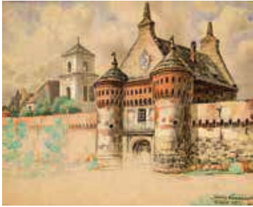
89. Subačiaus vartai / Subačius Gate. 1897 Popierius, akvarelė, guašas, anglies pieštukas / Watercolour, gouache and charcoal on paper, 40,8x50,3 Sign. ap. d.: Juozapas Komarauskas / Vilnius 1897-VII LDM nuo 1980, T-7721