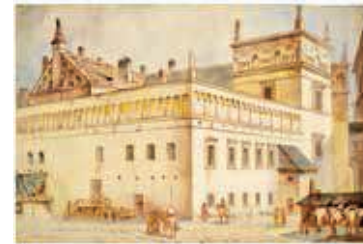
81. Vilnius. Žemutinė pilis / Vilnius. Lower Castle. 1897 Popierius, akvarelė / Watercolour on paper, 34,2x51,3 Sign. ap. d.: Juozapas Komarovsky / Vilnius- 1897 m LDM nuo 1980, T-8220