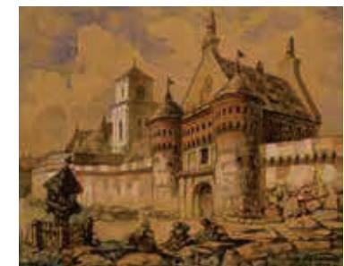
88. Subačiaus vartai / Subačius Gate. 1896 Popierius, akvarelė, gvašas / Watercolour and gouache on paper, 40,8x50,5 Sign. ap. d.: Juozapas Kamarauskas / VILNIUS 1896 m. LDM nuo 1980, T-10565